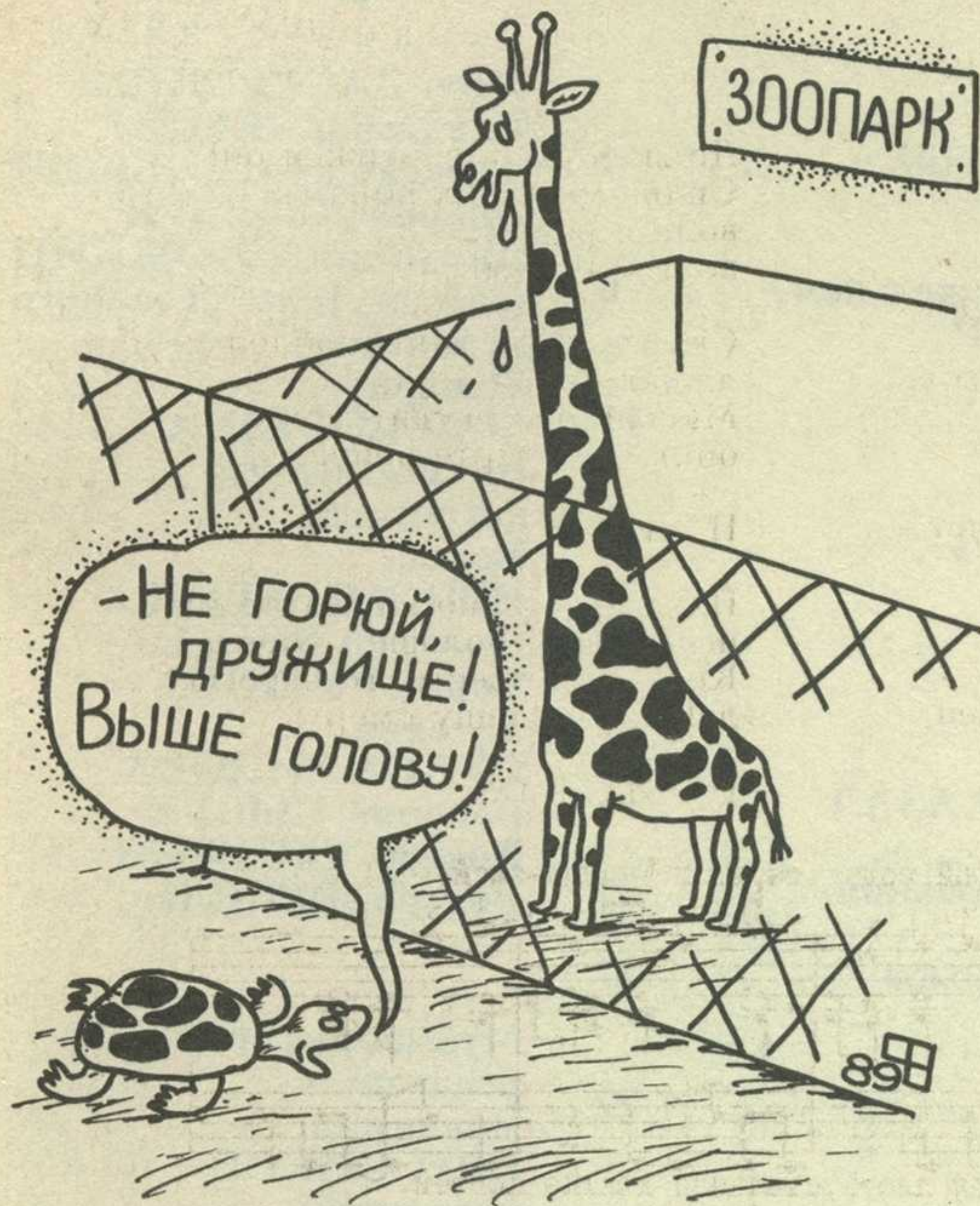
Рисунок В. ФЕДОРОВА. Севастополь.